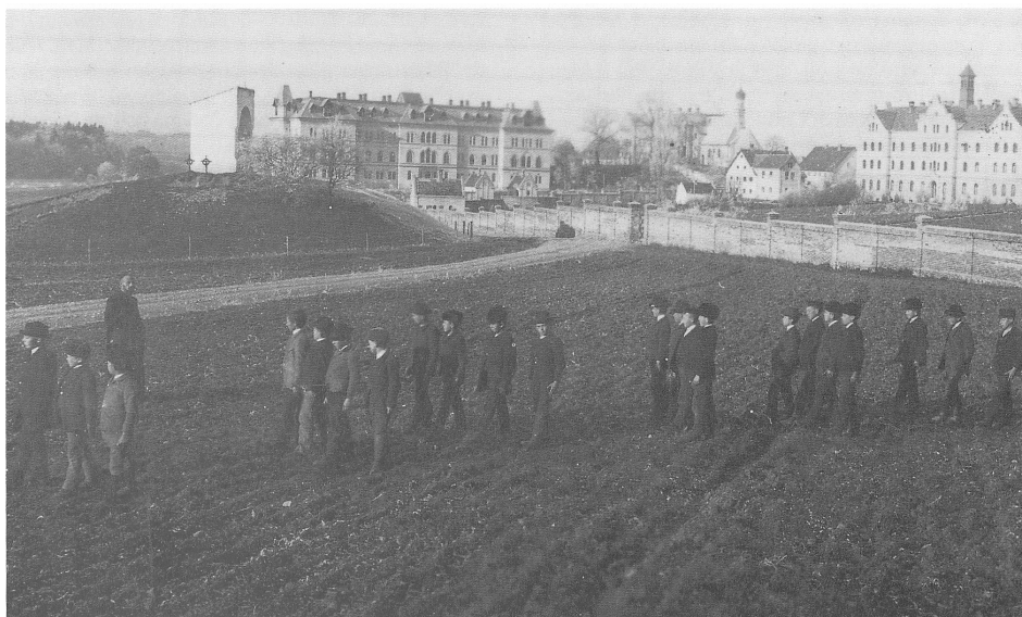
Alumni seminarii anno 1896° in ambulando. [Franz AUER (red.): 100 Jahre Gymnasium (1991), p. 9.]

ter faciendae expressis verbis commemorantur. 67