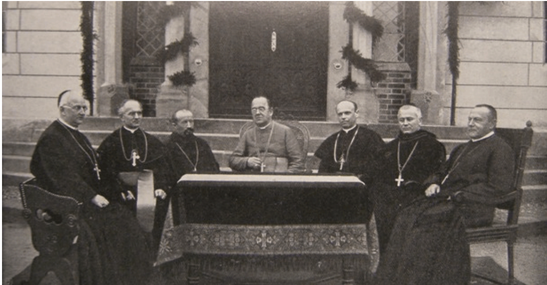
Photographema post consecrationem episcopi receptum.